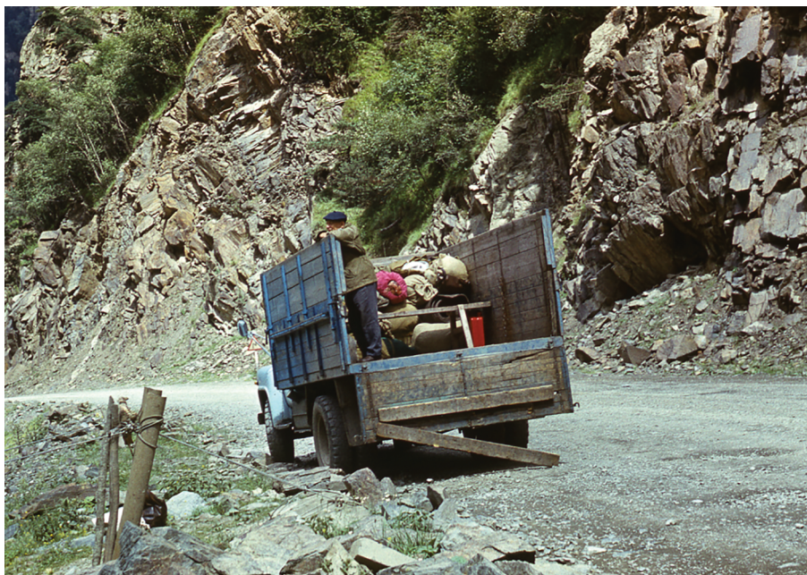
Рис. 10. Л.Г. Динесман, Северная Осетия, 1988 г.

ни. В частности, этот процесс отразился, судя по результатам изучения зоогенных отложений, в смене ксерофитных злаков в составе растительности более мезофитными. Колебания теплового режима и обводненности на этом однонаправленном процессе сказались также слабо. Следует подчеркнуть, что приобретение растительным покровом более мезофитного характера — типичный эндогенный биоценотический процесс для разных районов Земного шара.